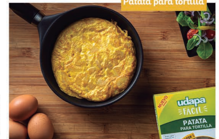
Patata para tortilla

Cocina todas las recetas tradicionales de una manera más rápida y saludable.