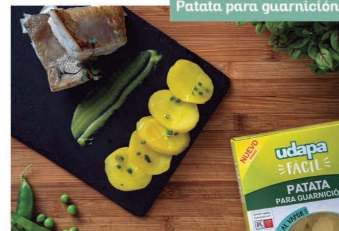
Patata para guarnición