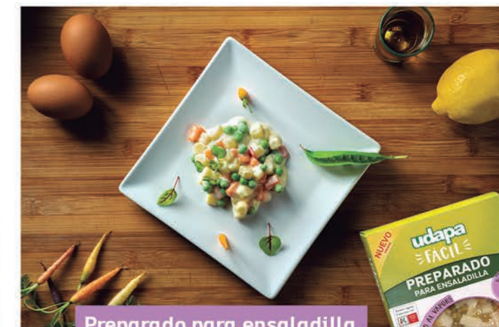
Preparado para ensaladilla