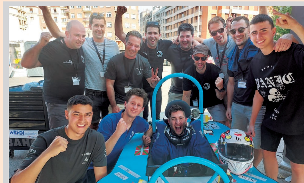
Menditech, el equipo del CIFP Mendizabala LHII, logró alzarse con la victoria en la sexta edición de esta prueba, celebrada en Bilbao.

Tras su participación inaugural en 2018, el equipo Menditech no volvió a competir hasta el curso 21/22 debido a la pandemia. Sin embargo, retomó el desafío en busca de los premios de innovación y sostenibilidad con renovadas energías. Aunque logró el premio a la innovación gracias a aspectos técnicos vanguardistas, como retrovisores por cámaras y una transmisión con diferencial y variador, el alto consumo de la batería por estos elementos innovadores le hizo enfrentarse al desafío de la resistencia. En la última edición 22/23, el equipo redobló esfuerzos y logró una impresionante reducción de peso en el vehículo. Utilizando una novedosa base de chasis de fibra de carbono al estilo de los monoplazas de F1 y aluminio para el arco de seguridad, junto con un rediseño de la transmisión para minimizar las pérdidas de energía. La principal estrategia para reducir el peso del vehículo se logró mediante la implementación de un chasis de fibra de carbono. En la edición anterior, el chasis era una estructura de cuadrado de metal, que, aunque robusta, contribuía significativamente al peso total del conjunto, especialmente al considerar otros elementos como las suspensiones. Al enfrentarse a este desafío, los estudiantes se inspiraron en los monoplazas más avanzados, todos los cuales compartían una ca-